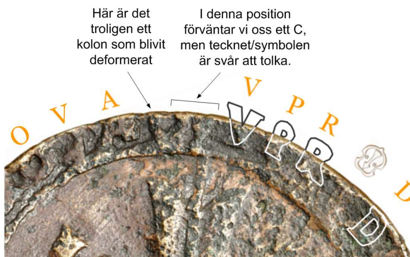
8. Tre av de fyra tecknen har identifierats.

Vi förväntar oss ett C före VPR, men på platsen för C finns en krumelur som är omöjlig att tolka. Bild 8.