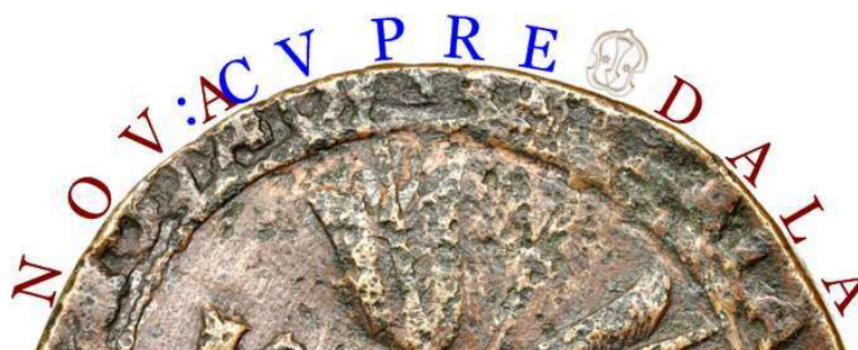
4. Brun text avser det aktuella myntets omskrift. Den blå texten är hämtad från myntet CS 18. Som synes får inte den blå texten plats i det skadade området.

Som framgår av bild 4 passar inte CVPRE in i det skadade området. Låt oss istället prova CVPR (). Omskriften hämtas från myntet CS 12. Bild 5.