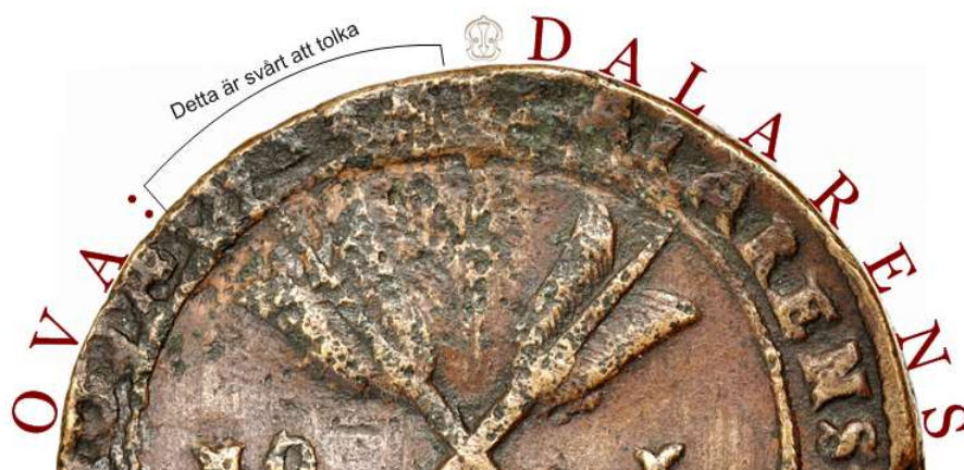
2. Närbild av frånsidans skadade område.

Under försöket att tolka det skadade området på frånsidan föreslås som hypotes att det står CVPR eller CVPRE. Bild 2.