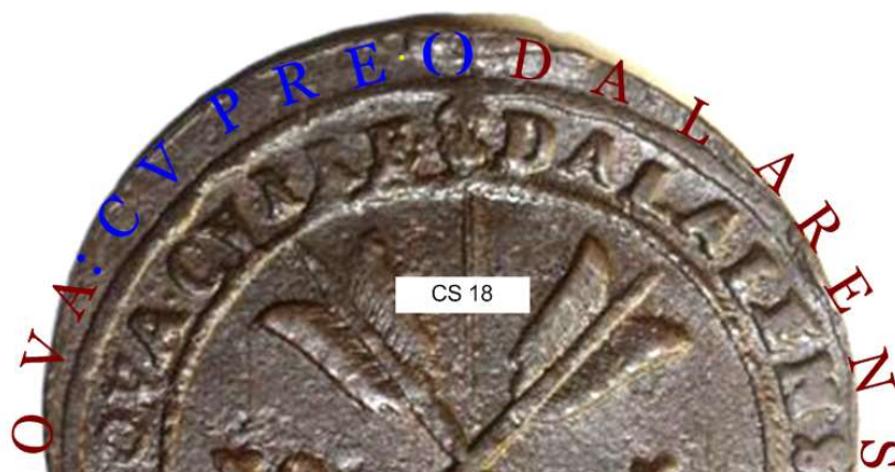
3. Omskriften CVPRE hämtas från myntet CS 18

Låt oss först prova CVPRE (). Texten hämtas från myntet CS 18. Bild 3.