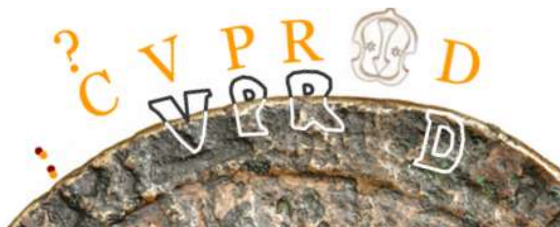
7. Förslag till omskrift i det skadade området.

Se bild 7. Fyra tecken fyller precis upp utrymmet mellan kolon och myntmästarmärke. Det första av dessa fyra tecken är fortfarande ett mysterium.