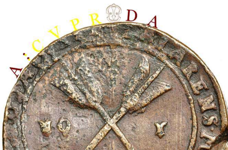
6. Brun text avser det aktuella myntets omskrift. Den gula texten är hämtad från myntet CS 12. Som synes får den gula texten plats i det skadade området.

Steg 1 av analysen har nu genomförts, och det visar sig att omskriften i det skadade området möjligen skulle kunna vara CVPR. Bild 6. I nästa steg söker vi belägg för att den hypotesen håller.